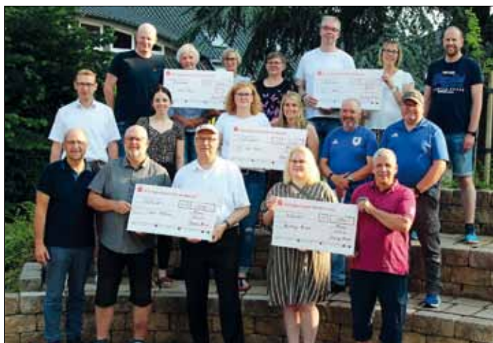
2.500 Euro aus der Kolpingkasse - davon profitierten 4 Merzener Vereine und Organisationen sowie die Fürstenuauer Tafel