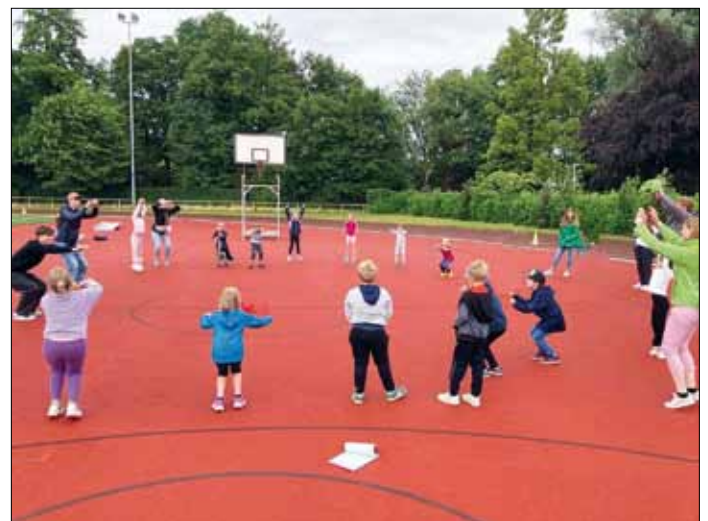
Beim inklusiven Sportabzeigentag in Bersenbrück absolvierten die Kinder der Kita im Pfarrheim das Tölwi-Abzeichen.