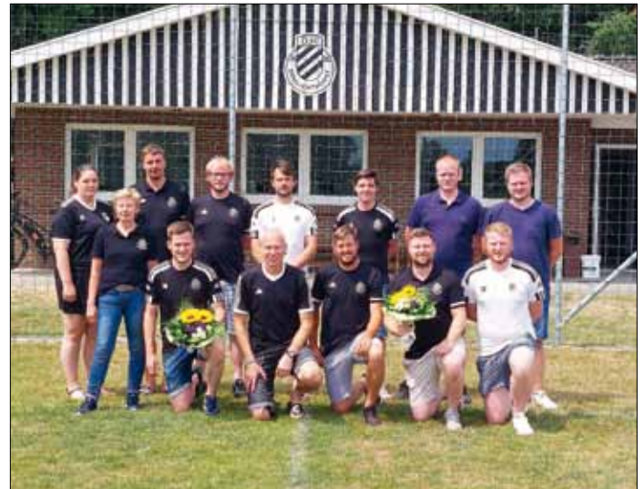
Das Foto zeigt den aktuellen Vorstand mit den scheidenden Mitgliedern (mit Blumenstrauß) und den neuen Vorstandsmitgliedern (rechts u. + rechts o.).

Sportplätzen der DJK vom 26.07. – 30.07.23 stattfindet. Am 05.08. findet eine Kinderferienspaßaktion mit einer Kinderolympiade auf dem Sportplatz der DJK statt.