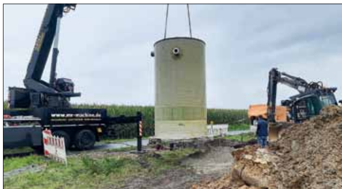
Über das neue Zwischenpumpwerk und eine neue Druckrohrleitung wird das Abwasser ab dem kommenden Jahr zur Kläranlage nach Neuenkirchen transportiert.

In Zukunft wird der Klärschlammspeicher der Kläranlage Voltlage als Havarie-Behälter bei Störungen im Kanalnetz oder für Starkregenereignissen genutzt.